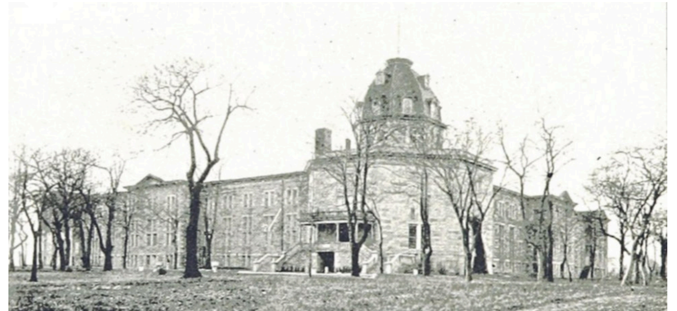
Asyl für nervenranke Frauen auf der New Yorker Blackwell's Island im East River

Viele der Gerüchte über diesen Ort bestätigten sich nicht nur, es war sogar schlimmer. Das Brot war verschimmelt, Obst verdorben und die Butter alt und ranzig. Die hygienischen Zustände waren ebenfalls katastrophal. Das Badewasser wurde für die einzelnen Patientinnen nicht gewechselt, Seife gab es nur einmal wö-